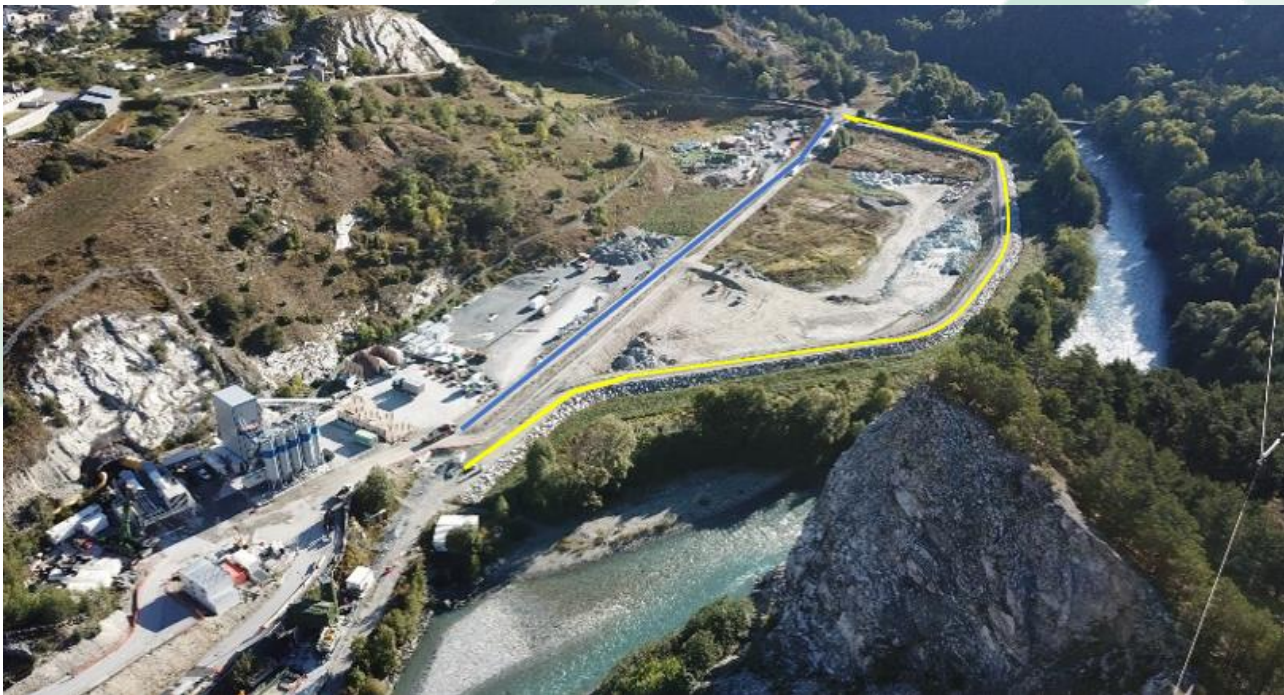
Accès piétons / vélos en jaune sur ce plan – Partie de la piste ONERA fermée en bleu – Site du Moulin

Ces accès récemment réalisés améliorent l'itinéraire mode doux.