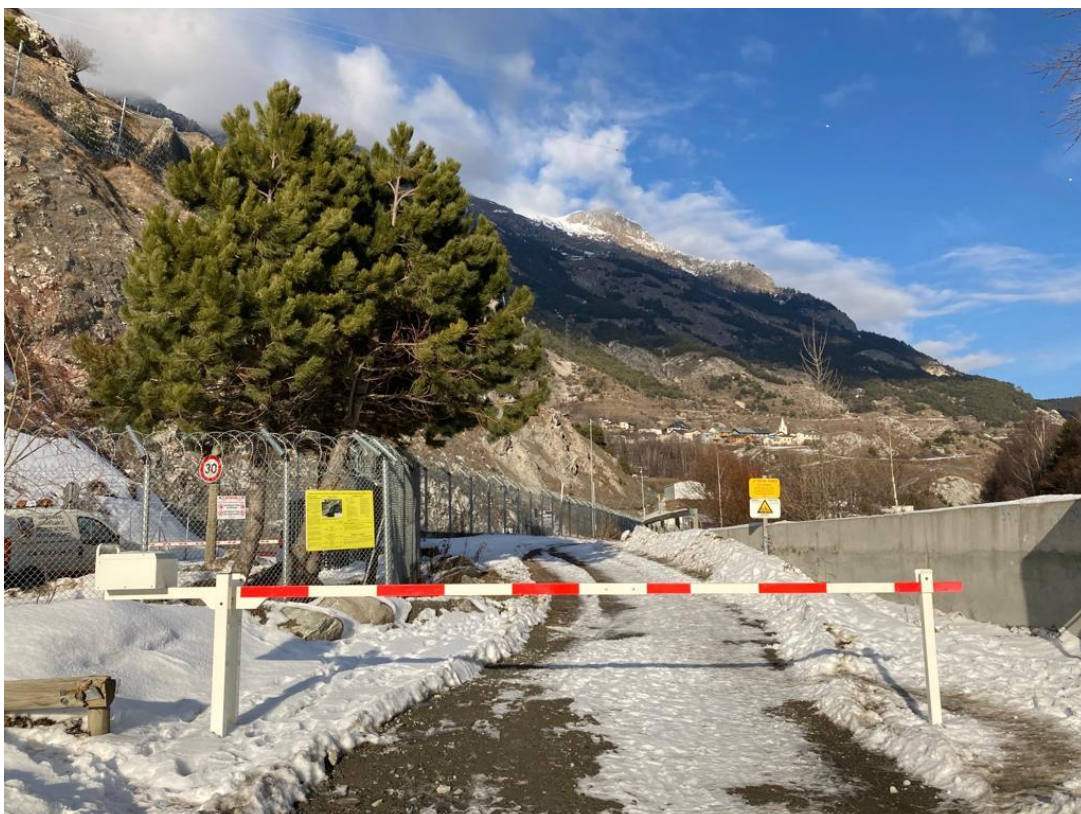
Barrière à l'entrée de la piste de l'ONERA