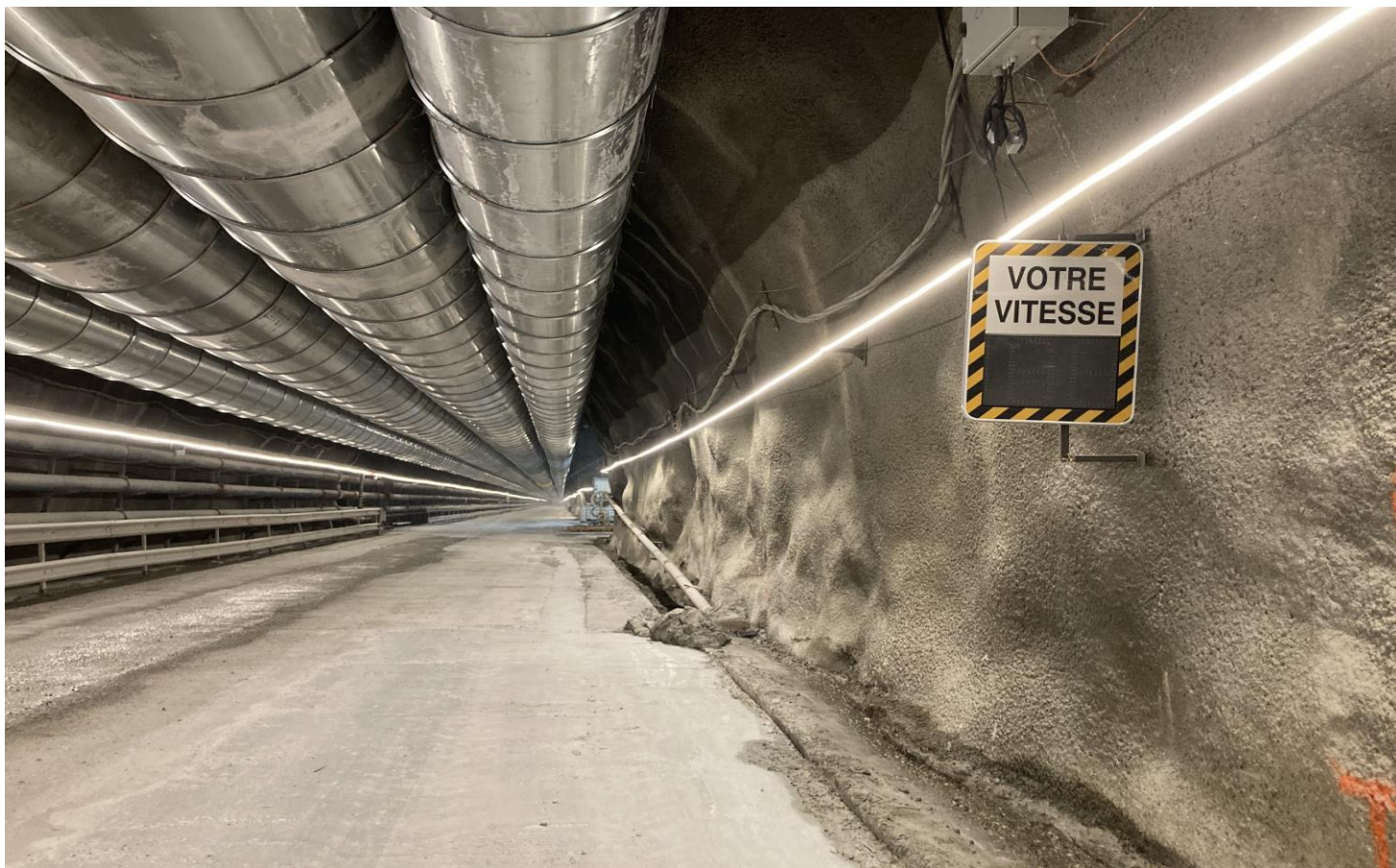
Radars de vitesse dans la descendrière de Villarodin-Bourget / Modane